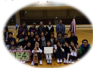
職員親睦ソフトバレーボール大会

私たちは 技術・知識の向上に努め、患者様に安心、 満足していただける ていねいな看護を提供します。