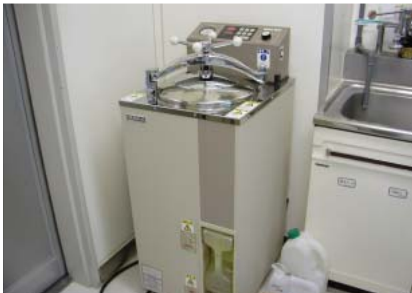
高圧蒸気滅菌(オートクレーブ)の機械