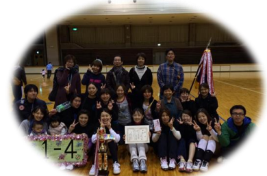
職員親睦ソフトバレーボール大会